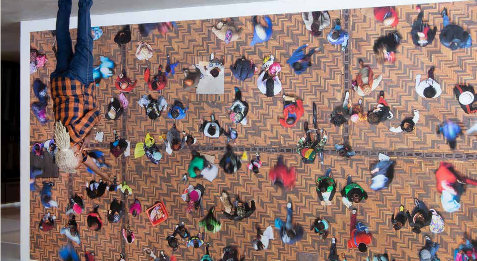
Katrin Korfmann, Anton de Komplein, 2018, 267 x 489 cm, fotografie

© BRADWOLFF & PARTNERS 2019 / KATRIN KORFMANN / DESIGN KEES JANMAAT